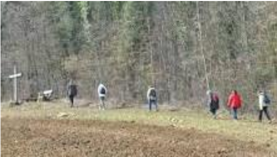
Plus qu'une marche, une démarche spirituelle...

Le Pèlerinage Marie-Reine-de-la-Paix nous vient de la Pologne. Il commence à Montréal en 1984, avec le thème « La paix par la réconciliation » et encouragé par les évêques des parcours.