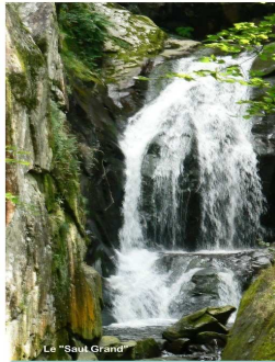
Le Saut Grand