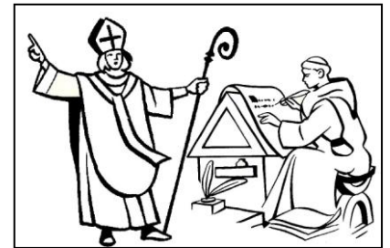
Les hommes d'Église