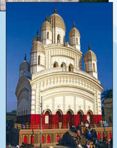
Temple de Kali