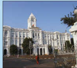
Le fort Saint-George qui abrite le Musée militaire.

Appelée aussi Chennai. Elle possède un grand port et la deuxième plus longue plage du monde, Marina Beach (12 km).