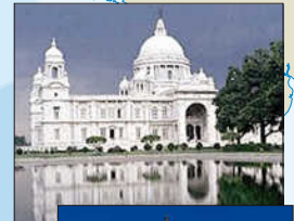
Victoria Memorial Hall

Capitale des Indes britanniques de 1772 à 1912. C'est l'un des plus grands ports d'Asie méridionale . Immense ville industrielle, elle est connue pour ses bidonvilles, mais aussi pour sa très grande activité culturelle. Elle est aussi appelée Kolkata.