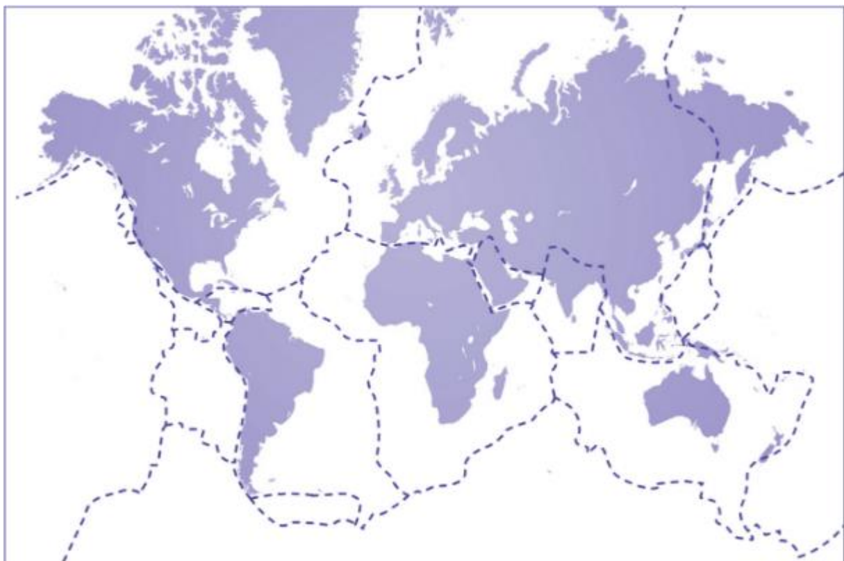
Frontières des différentes plaques qui composent la croûte terrestre.