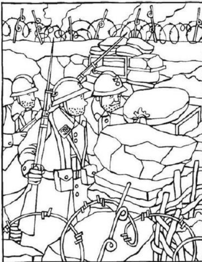
Coloriage de Ehrhard et Editions Ouest-France pour Hugolescargot