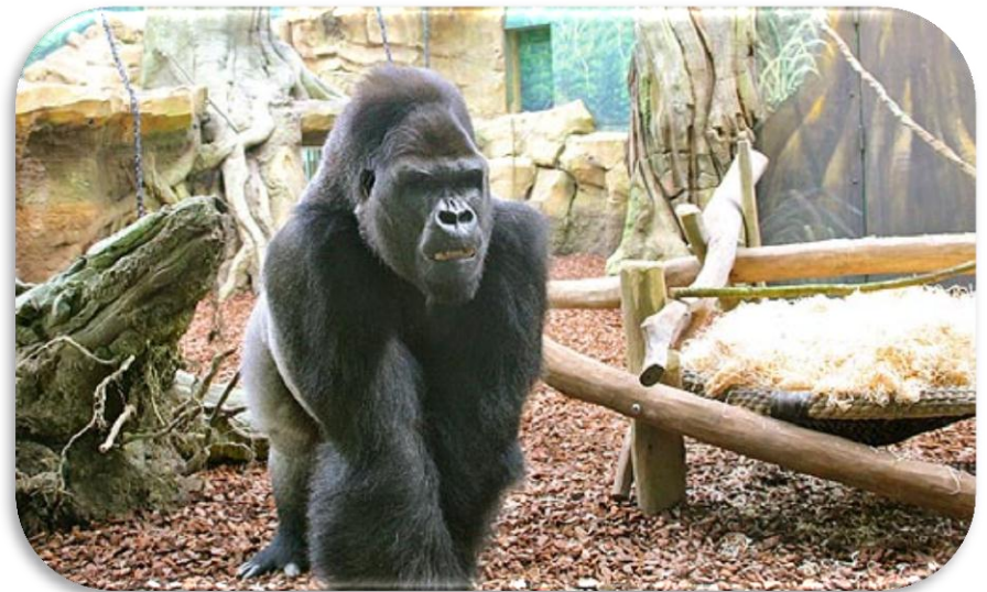
Ya Kwanza, l'autre mâle