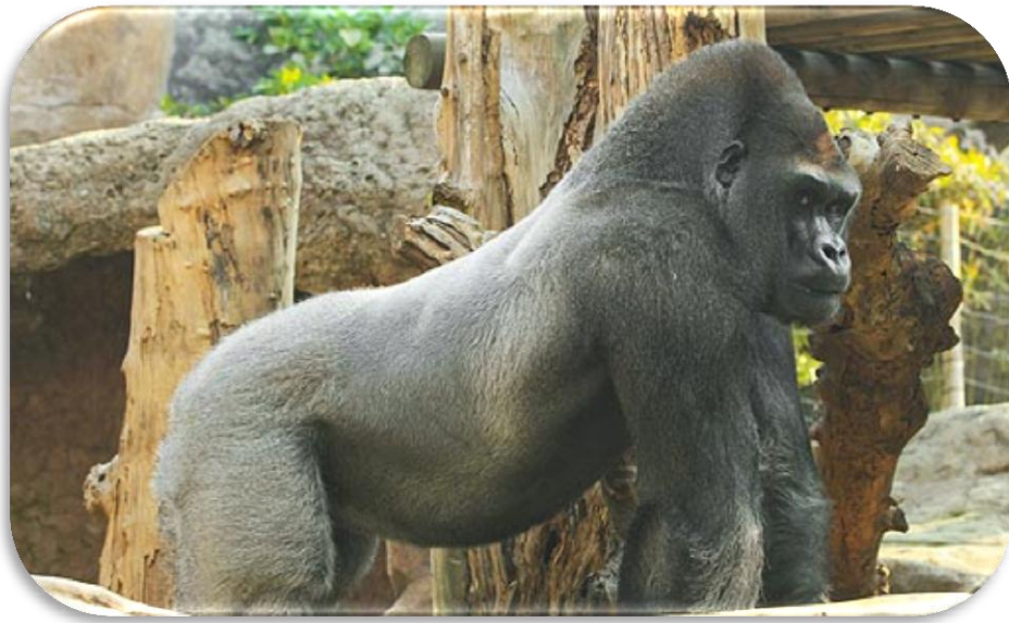
Akwali, mâle au dos argenté