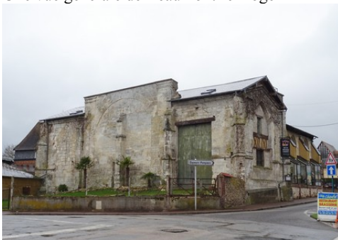
Une ancienne église transformée