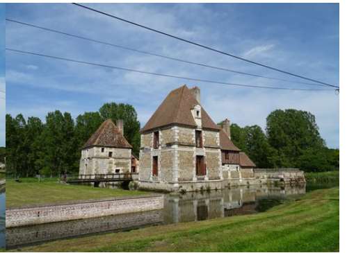
Les pavillons d'angle du manoir