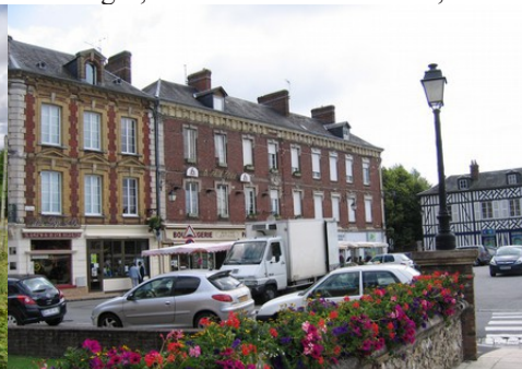
Quelques maisons en centre-ville