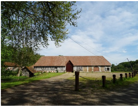
Les communs vus de la route