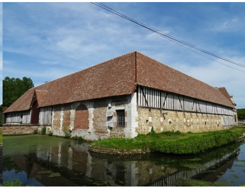
Les communs et leurs douves