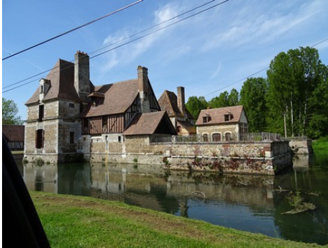
Les vestiges de l'aile Sud