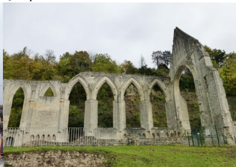
Les vestiges du prieuré de Beaumont