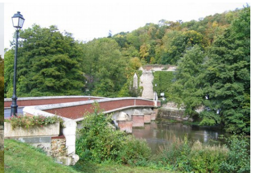
Un pont sur la Risle