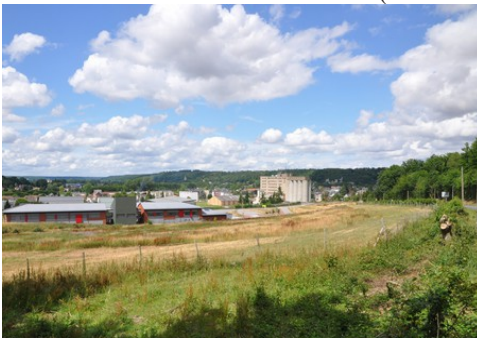
Une vue générale de Beaumont-le-Roger

Les avis seront cohérents avec ceux émis ces dernières années, à savoir : pas de maisons à volume compliqué (type V, W, Y, ou Z), Rez-de-chaussée + Combles, pentes à 45° pour les volumes principaux, ardoise ou tuile plate de teinte brun vieilli, à 20u/m 2 , avec un débord de toiture de 20cm, enduit de teinte beige clair avec modénatures (au choix : chaînages, encadrement de fenêtres, soubassement, colombage...). *Voir autres fiches.