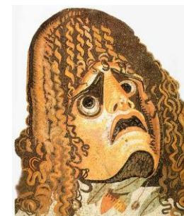
Masque de théâtre

L'orchestre est l'endroit où se place le chœur.