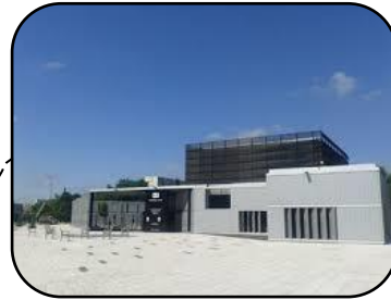
La médiathèque grand M

Je connais trois pays d'Asie, leurs musiques traditionnelles, le théâtre d'ombres, trois albums, la calligraphie et l'art chinois, un musée et une médiathèque de ma ville.