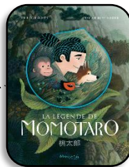
La légende de Momotaro