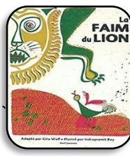
La faim du lion