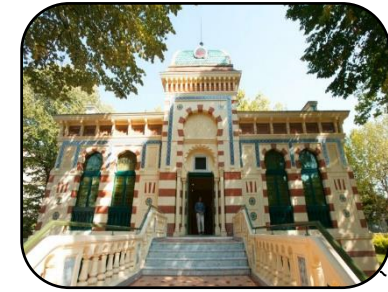
Le Musée Georges Labit