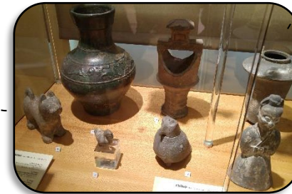
la collection chinoise