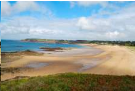
La même plage à marée basse.

Voit-on le même paysage sur ces deux photos ? Pourtant il y a une grosse différence ; laquelle ?