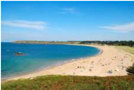
Une plage à marée haute.

Si nous goûtons de l'eau de mer, que remarquerons-nous ?