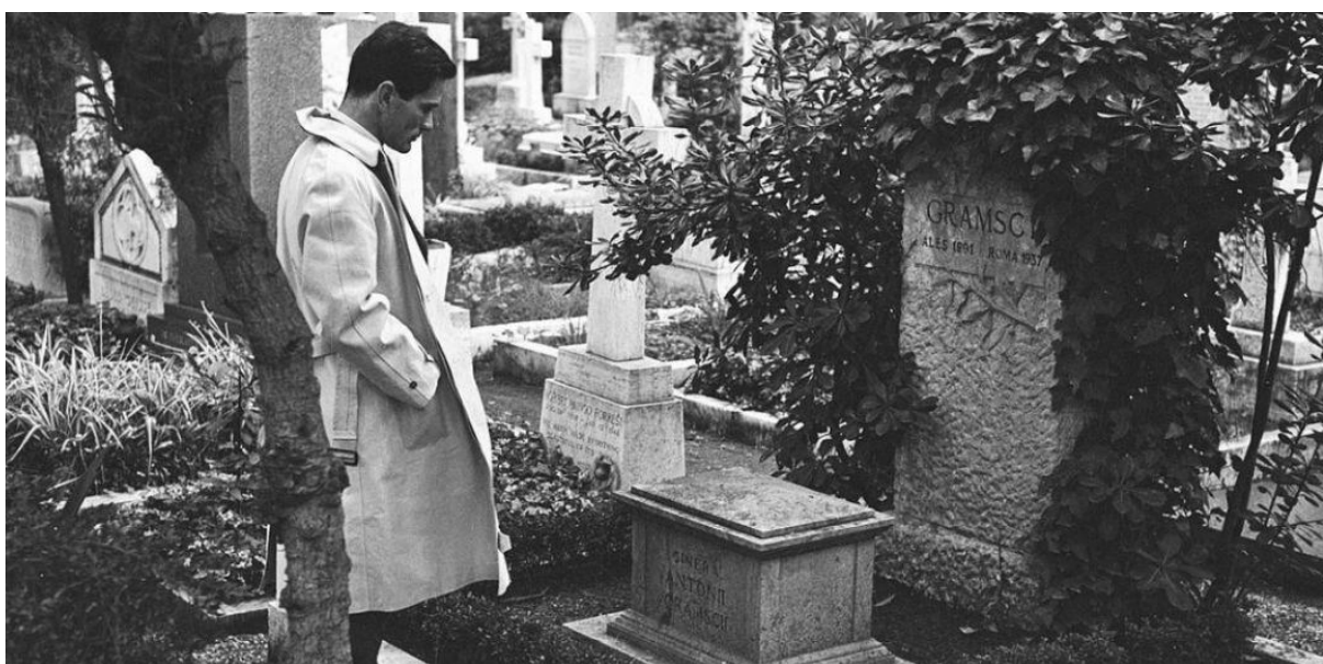
Pier Paolo Pasolini sur la tombe d'Antonio Gramsci

L'iconoclasme du cinéaste italien, mort sur une plage d'Ostie il y a quarante ans, en a fait l'un des meilleurs critiques de la gauche et de la société de consommation, mais a aussi conduit l'extrême-droite à détourner sa pensée.