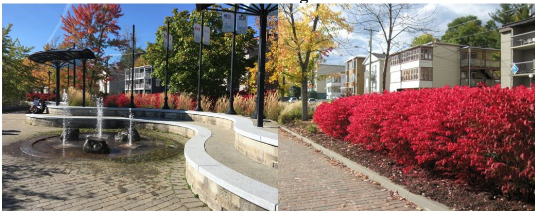
Montage photo Promenade du Lac des Nations (Richard)