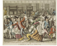
Doc C Gravure de 1797