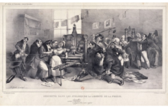
Doc D Caricature de 1834