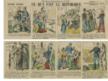
Doc E Estampe d'Alphonse de 1881