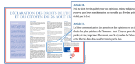
Doc B Déclaration des droits de l'Homme et du citoyen de 1789