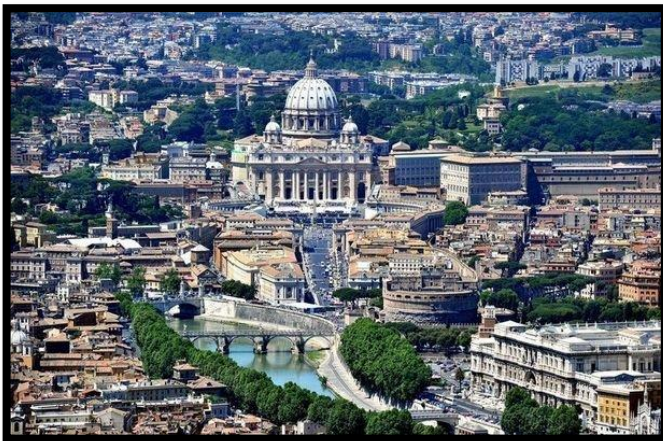
Quartier d'affaires - Rome