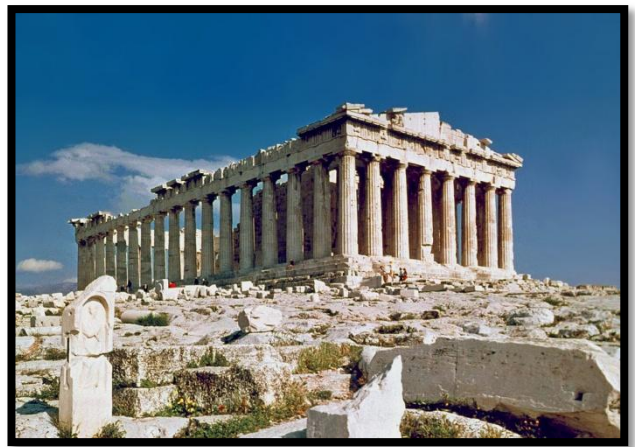
Le Parthénon - Athènes