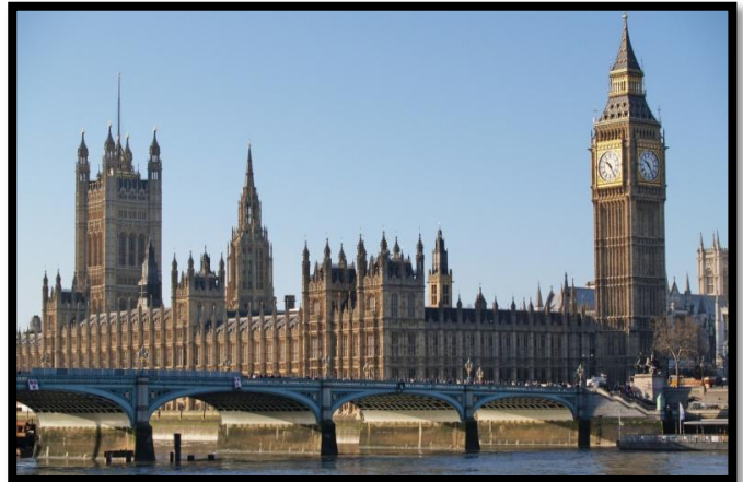
Abbaye de Westminster - Londres