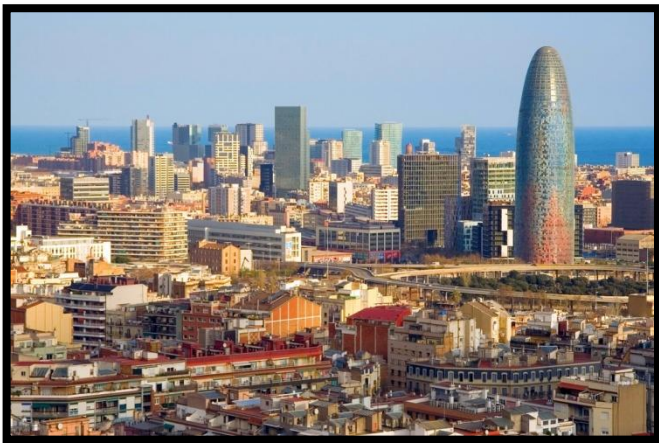
Quartier d'affaires - Barcelone