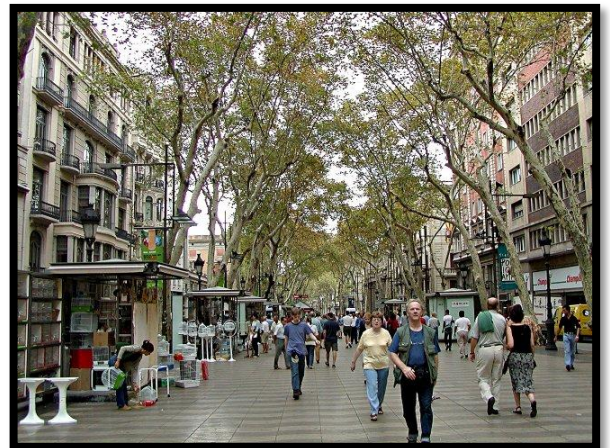
Quartier résidentiel - Barcelone