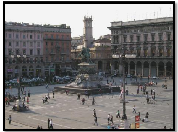
Piazza del duomo - Milan