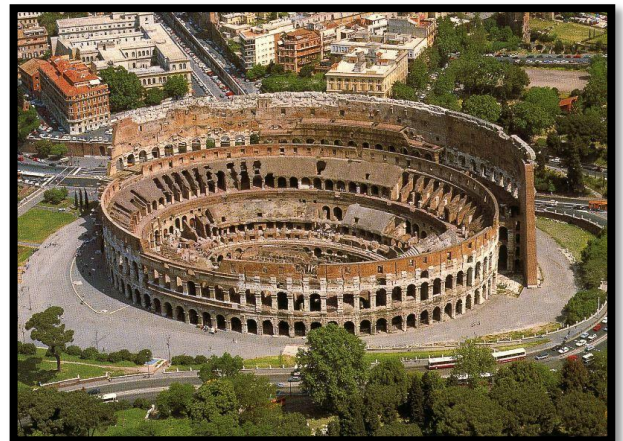
Le Colisée - Rome