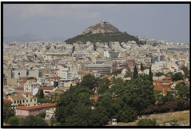
Quartier d'affaires - Athènes