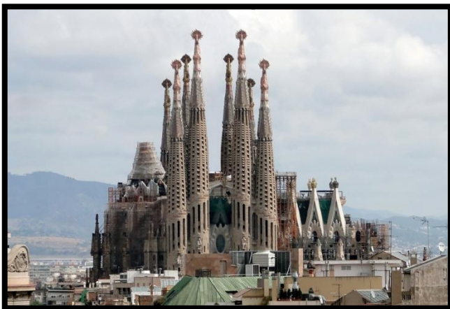
La Sagrada Família - Barcelone