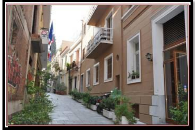
Quartier résidentiel - Athènes