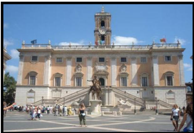
Le Capitole - Rome