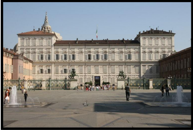
Palais royal - Milan