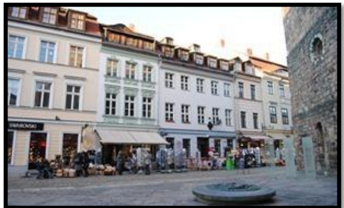
Quartier résidentiel - Berlin