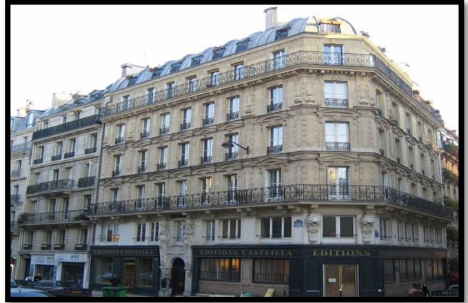
Quartier résidentiel - Paris