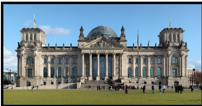
Palais du Reichstag - Berlin