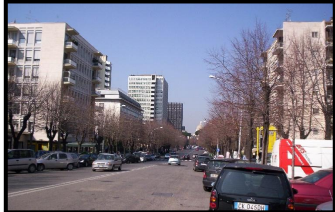
Quartier résidentiel - Rome