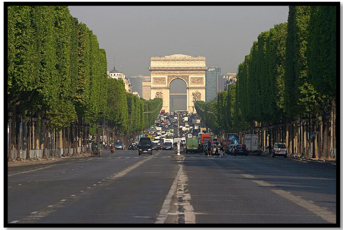
L'Arc de Triomphe - Paris