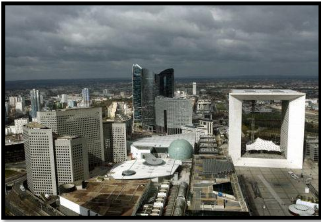
Quartier d'affaires - Paris