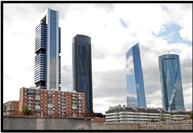
Quartier d'affaires - Madrid