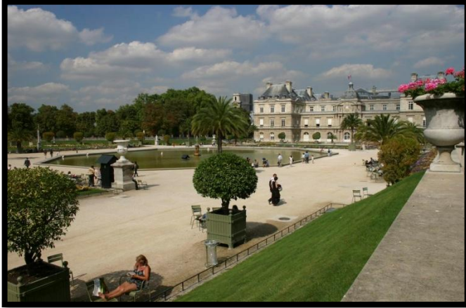
Le Sénat - Paris