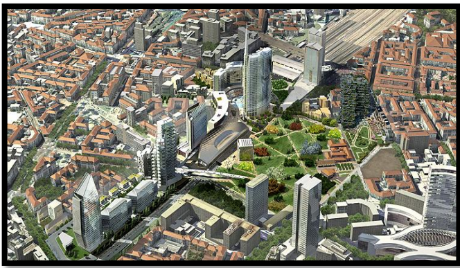
Quartier d'affaires Porta Nuova - Milan