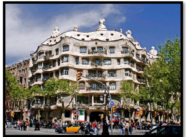
Passage de Gracia - Barcelone