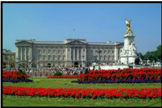
Buckingham Palace - Londres