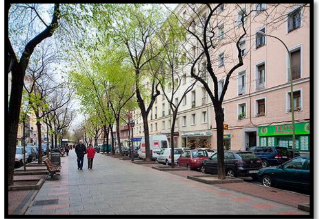
Quartier résidentiel - Madrid