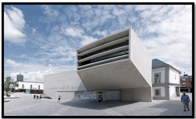
Nouveau centre culturel - Madrid