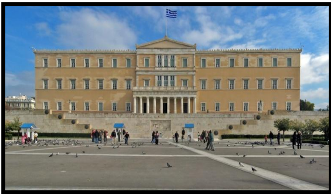
Parlement grec - Athènes