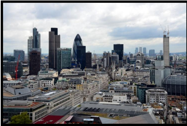
Quartier d'affaires - Londres