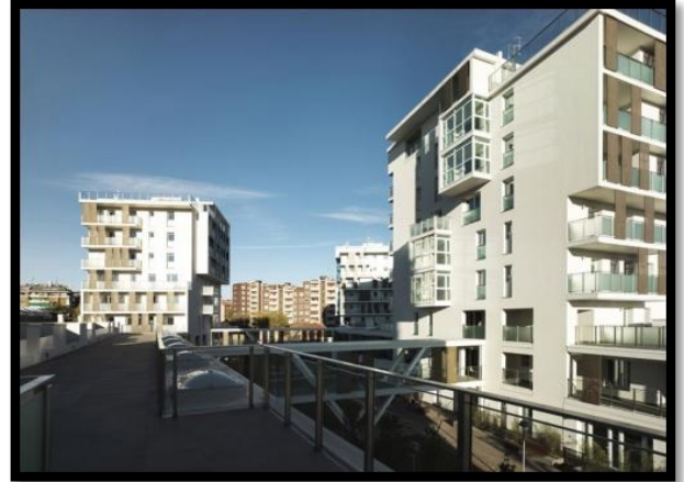
Quartier résidentiel - Milan