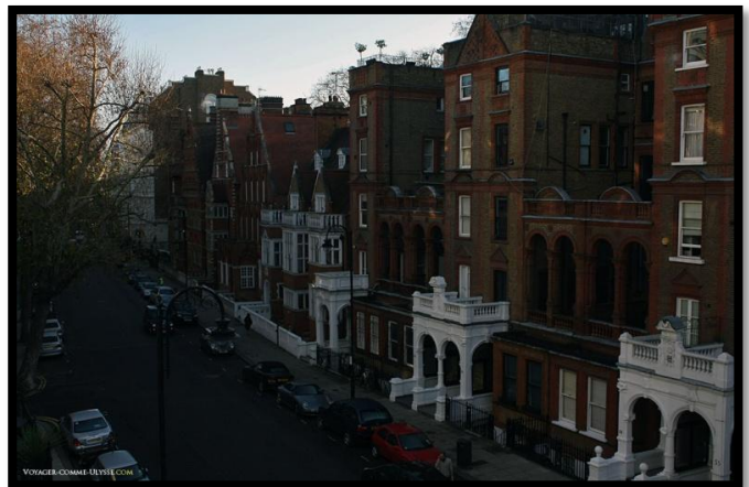
Quartier résidentiel - Londres