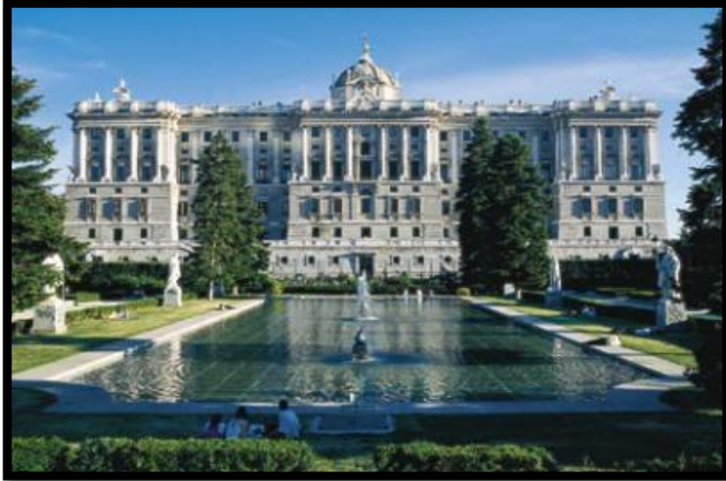
Le palais royal - Madrid