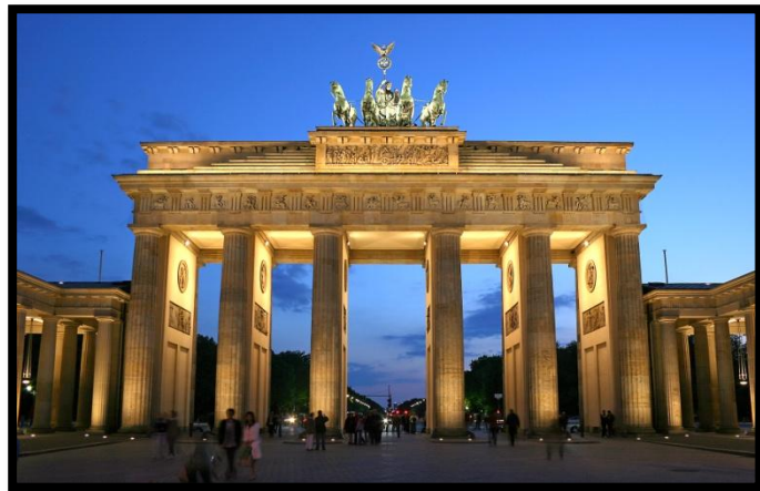
Porte de Brandebourg - Berlin