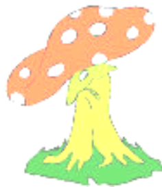
luminosité plus accentuée