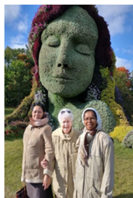
Exposition mosaïque à Québec

Comment je résume les choses après avoir visité quelques endroits.