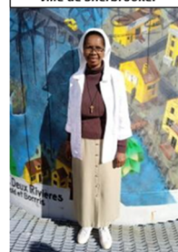
Visite des Murales à la ville de Sherbrooke.