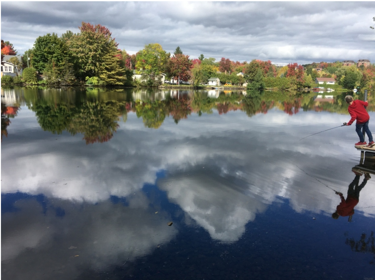
(Les nuages, les arbres, même le pêcheur flottant sur la rivière lisse comme un miroir.)

Comme Pâques sera très bientôt là, Sa résurrection est éminente, et dans ce contexte, l'été est à nos portes, accueillons ce cadeau du Seigneur.