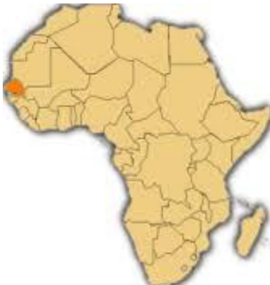
La carte de l'Afrique

Le Sénégal est membre de l'Organisation Internationale de la Francophonie depuis 1970.