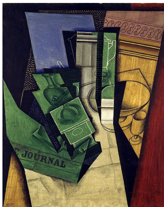
Juan Gris - Le petit déjeuner - 1915