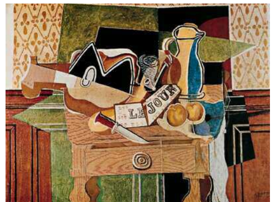
Georges Braque - Le jour - 1929