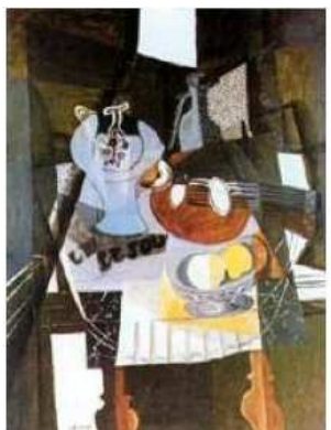
Georges Braque - Nature Morte au Comptoir