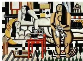
Le Grand Déjeuner - Fernand Léger - 1921