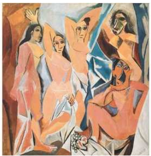
Pablo Picasso - Les Femmes d'Alger (O. J. R.)