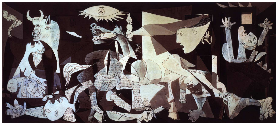
Picasso - Guernica - 1937

Les deux artistes ont déconstruit des objets et les ont « analysés » en termes de formes. Les peintures de Picasso et de Braque de ce moment-là ont de nombreuses similitudes. Le cubisme synthétique (1912-1919) a été la suite du développement du genre.