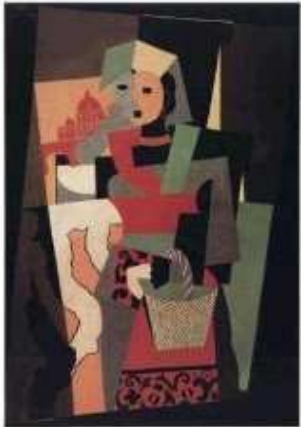
Pablo Picasso - L'italienne, 1917