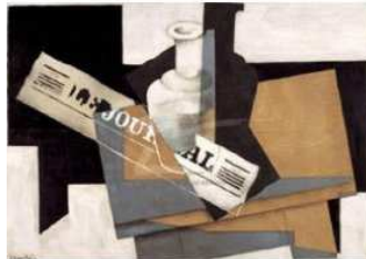
Juan Gris - Le Journal - 1916