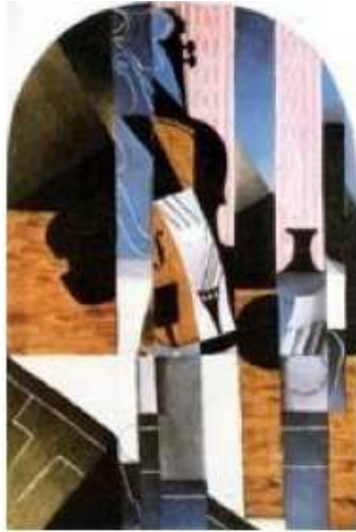
Juan Gris - Nature Morte