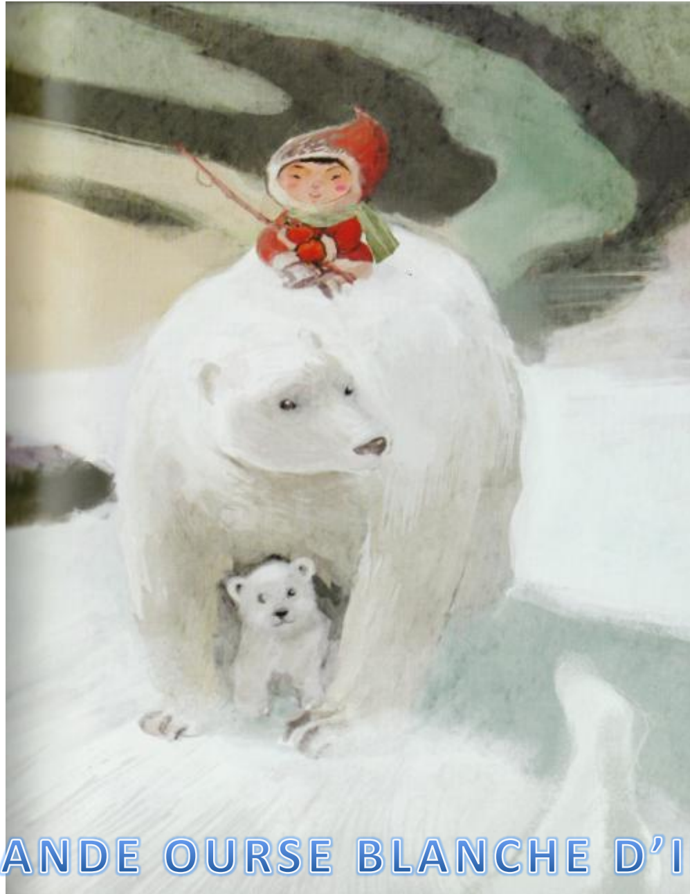
LA GRANDE OURSE BLANCHE D'IKOMO