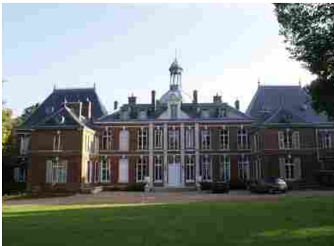
La façade ouest du château