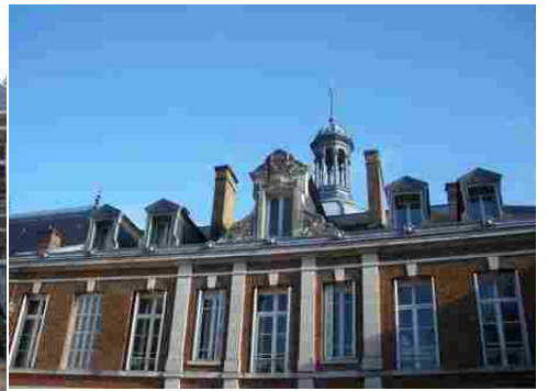
Le corps principal (vue rapprochée)