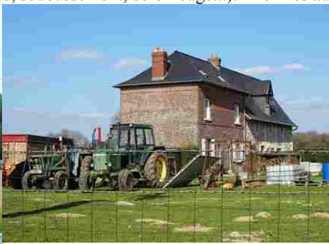
Une ferme mêlant briques et pierre