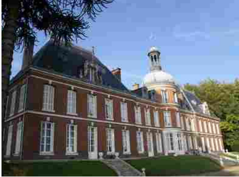
La façade est du château