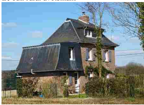
Une maison avec briques et ardoises