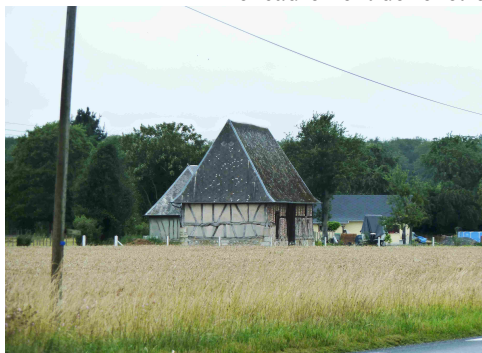
Le bâti rural avoisinant

Les avis seront cohérents avec ceux émis ces dernières années, à savoir : pas de maisons à volume compliqué (type V, W, Y, ou Z), pentes à 45° pour les volumes principaux, ardoise ou tuile plate de teinte brun vieilli, à 20u/m², avec un débord de toiture de 20cm, enduit de teinte beige clair avec modénatures (au choix : chaînages, encadrement de fenêtres, soubassement, colombage...). *Voir les autres fiches.