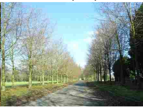
L'allée plantée menant au château