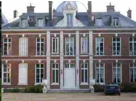
Le corps principal