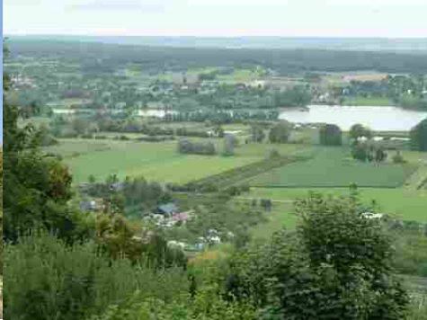
Le panorama sur la boucle de Jumièges