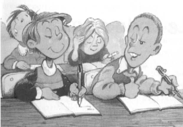
école ou parc d'attractions ? pourquoi ?