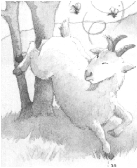
mouton ou chèvre ? pourquoi ?