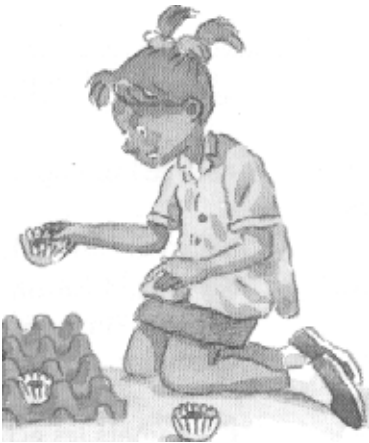
fille ou garçon ? pourquoi ?