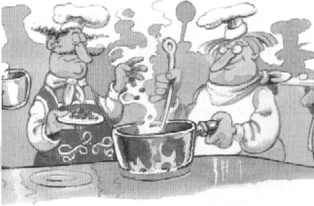
cuisinier ou peintre ? pourquoi ?