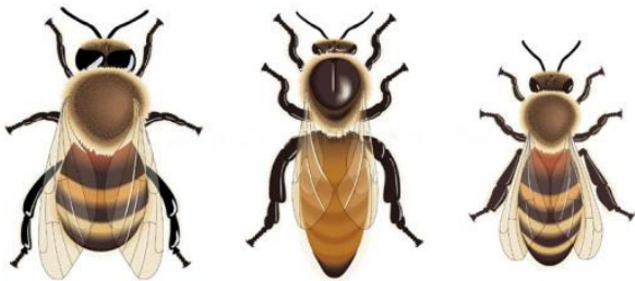
Le faux-bourdon La reine L'ouvrière

Les abeilles vivent dans des ruches, en colonie.