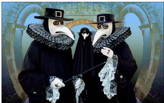
Masque du médecin de la peste