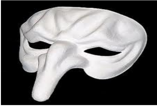
Le masque de Polichinelle