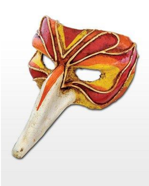
Masque de Scaramouche