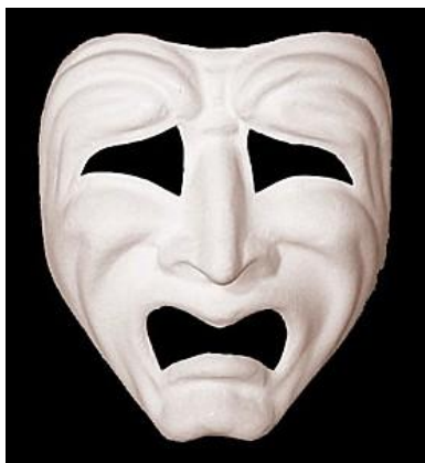
Masque de Piange