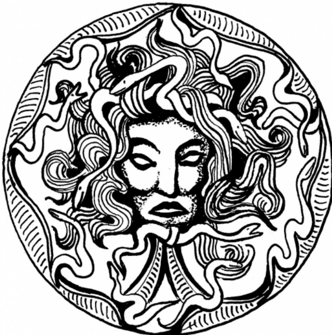
Tête de Méduse