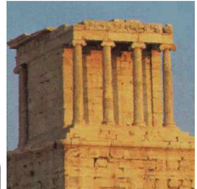
Temple d'Athéna Πικέ, c'est-à-dire Athéna la Victorieuse, sur l'Acropole d'Athènes