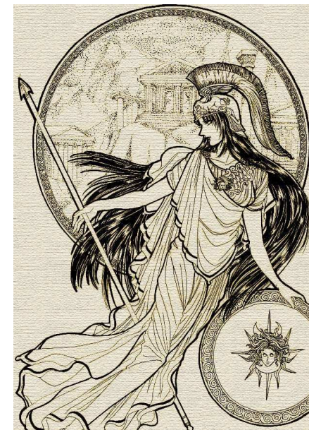
Αθήνα appelée Minerve dans la mythologie romaine