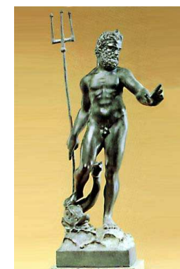
Ποσειδόν également appelé Neptune dans la mythologie romaine