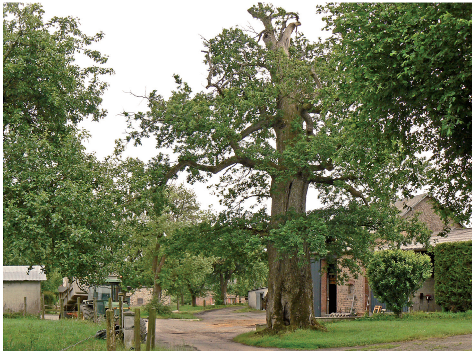
Le chêne à l'entrée de la ferme de La Motte

La commune d'Athis-de-l'Orne se trouve à 9 km au nord-est de Flers. Le chêne se trouve à l'entrée de la ferme de La Motte, 3,5 km au sud du bourg, route de Ronfeugeraï.