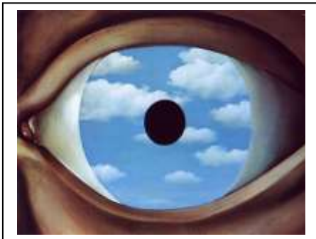
Le faux miroir