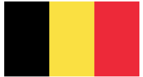
Musée Magritte à Bruxelles