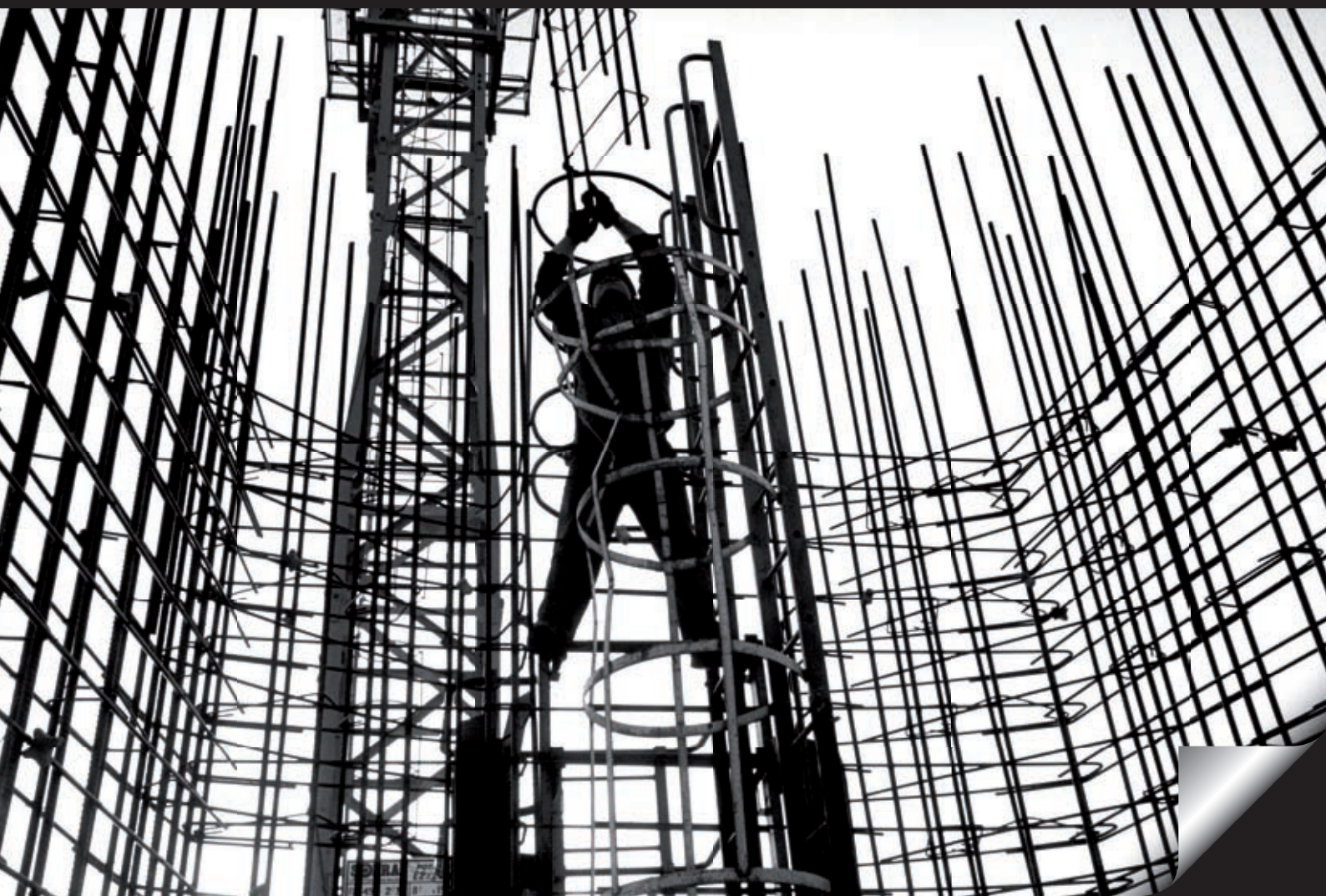
Pont de Normandie. 1992 © Jean Gaumy / Magnum Photos.