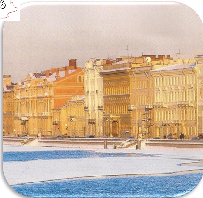
La rivière Neva à St Pétersbourg (Russie)