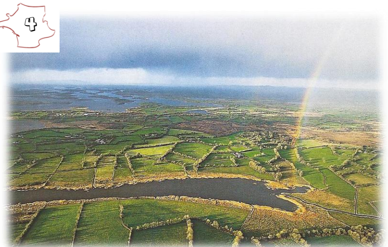
La campagne irlandaise