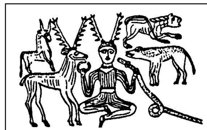
← Cernunnos, dieu aux bois de cerf, aux torques et au serpent à tête de bélier. Chaudron de Gundestrup, Danemark.

* Intermédiaire : personne permettant à d'autres de communiquer entre elles.