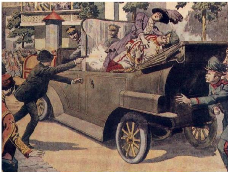
L'assassinat de l'Archiduc d'Autriche à Sarajevo le 28 juin 1914.

En juin 1914, un jeune Serbe assassine le prince héritier d'Autriche à Sarajevo. L'Allemagne pousse son alliée, l'Autriche à punir la Serbie et déclare la guerre à la Russie qui mobilisait ses troupes pour défendre ce pays dont elle est l'alliée. Le premier août, la France, alliée elle aussi de la Serbie mobilise ses troupes. Mais c'est l'Allemagne qui, le 3 août déclare la guerre et envahit la Belgique, pays neutre, pour nous attaquer par le nord. C'est le début de la Grande Guerre qui va mobiliser plus de 30 millions d'hommes de chaque côté.