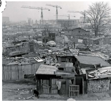
Bidonville à Nanterre, 1969. Au milieu du XX ème siècle, la plupart des logements n'avaient ni eau courante, ni WC, ni salle de bains, de nombreuses personnes vivaient encore dans des bidonvilles.