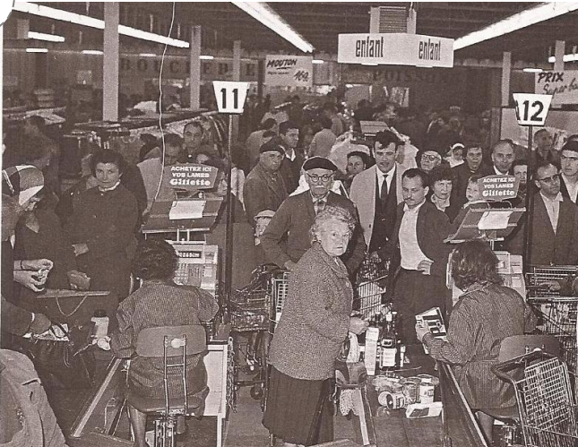
L'ouverture du premier hypermarché en France (Sainte-Geneviève-des-Bois, 15 juin 1963)