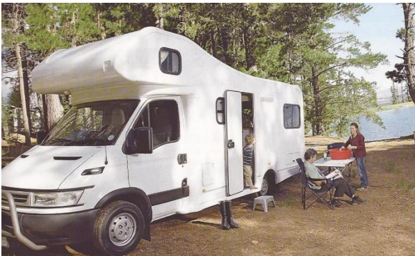
Les familles françaises en vacances au début du XX ème S