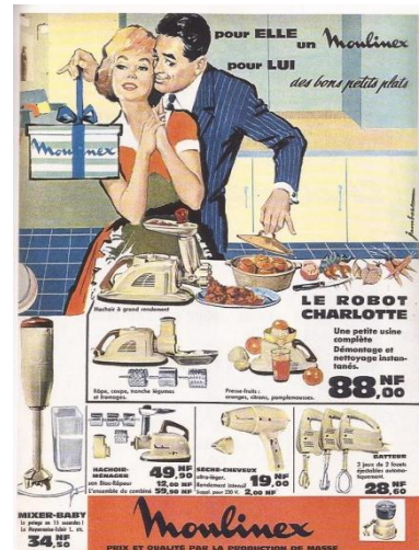
Une publicité des années 1950