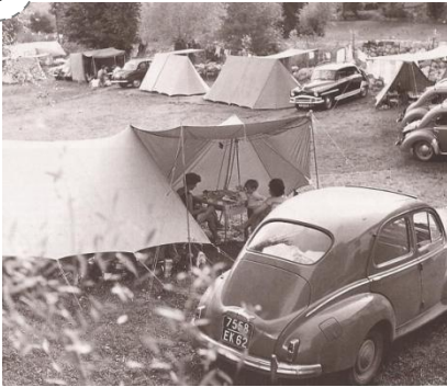
Les familles françaises en vacances en 1950