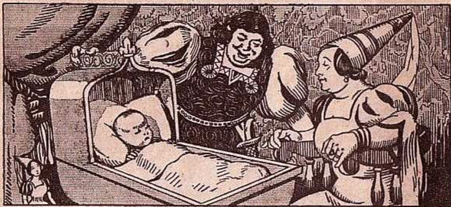
Grandgousier était un joyeux compère qui aimait bien manger et bien boire. Il épousa Gargamelle, la fille du roi des Géants et il leur naquit un fils qui s'appela Gargantua.