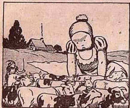
Gargantua était un nouveau-né peu ordinaire. Pour l'alimenter, on lui donna dix-sept mille neuf cent treize vaches laitières. Et c'est tout juste s'il en avait assez.