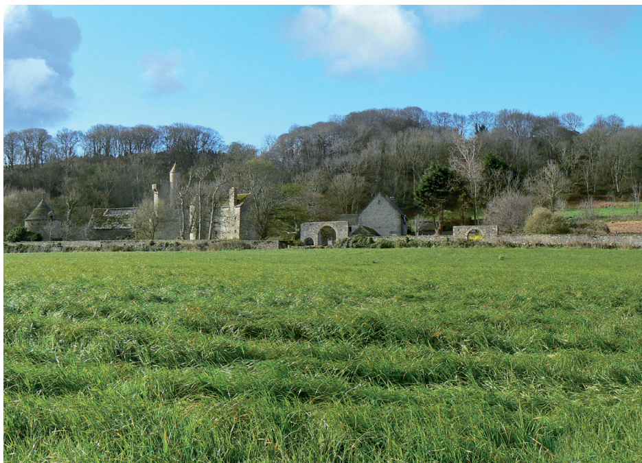
Le manoir vu du sentier du littoral

Dans les années 1990, les propriétaires ont souhaité ouvrir le parc du manoir à la visite. Les boisements, mis à mal par les tempêtes, ont été nettoyés et replantés de feuillus. Divers aménagements sont venus conforter un petit circuit de visite sur le chemin principal, le long du Candar et près du bief des moulins. Aujourd'hui, le manoir de Dur-Ecu, restauré, dresse son imposante silhouette devant son parc caché par la végétation. Seuls les abords des bâtiments sont dégagés et entretenus avec soin. La conservation de cette propriété privée dépend, comme bien d'autres manoirs et châteaux, des moyens que les propriétaires peuvent y consacrer. Même si deux moulins ont été transformés en gîtes, les sommes à investir demeurent sans doute importantes pour des travaux sans cesse renouvelés comme en témoigne la toiture d'une grange aujourd'hui effondrée.