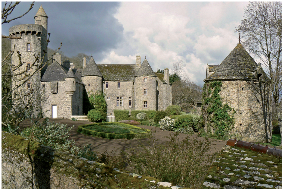
Le manoir de Dur-Ecu et son jardin