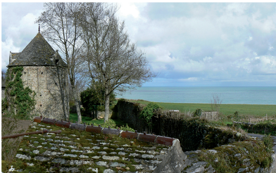
Le site au nord-ouest du manoir