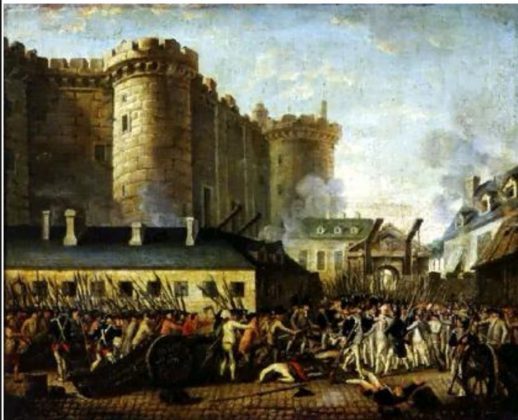
Prise de la Bastille - tableau du XVIII