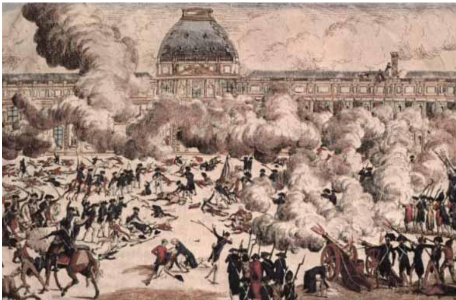
La prise des tuileries – 10 août 1792

Les Révolutionnaires réclament la déchéance du roi. Dans la nuit du 9 au 10 août, la garde nationale prend d'assaut le Palais des Tuileries. Malgré la résistance héroïque des gardes suisses, le Palais des Tuileries est envahi et incendié après les violents combats qui comptèrent plusieurs centaines de morts dans chaque camp. Le roi est arrêté et enfermé à la prison du Temple à Paris. Cette journée meurtrière entraîna la chute de la monarchie constitutionnelle.