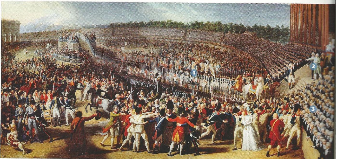
1/ Garde nationale (soldats révolutionnaires) 2/ Louis XVI 3/ Députés

14 juillet 1790 : le Roi prête serment lors de la fête de la Fédération