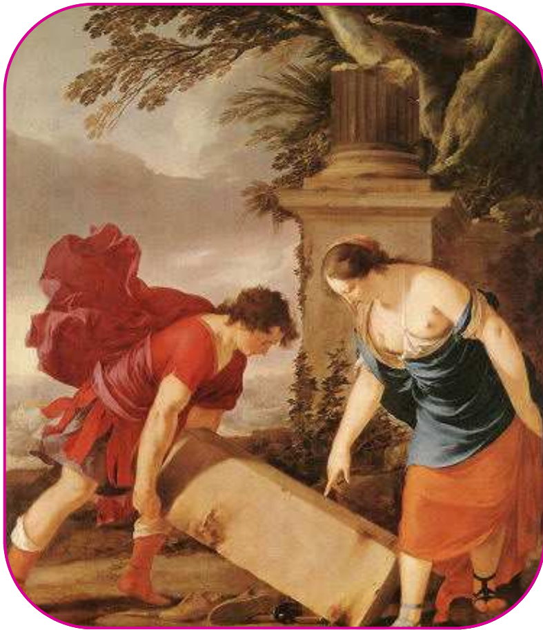
Thésée et Aethra d'après La Hire

Egée : Roi d'Athènes et père de Thésée. A l'annonce de la grossesse d'Aethra, Egée dut regagner Athènes car son trône était menacé. Il laissa sous un gros rocher son épée et ses sandales afin que plus tard son fils puisse se faire reconnaître.