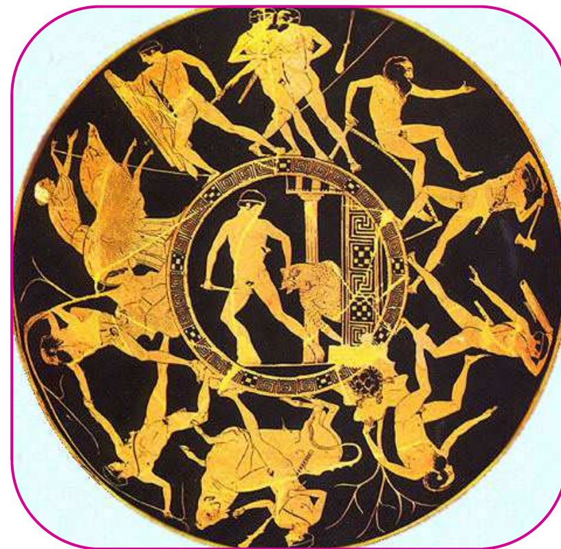
Les travaux de Thésée

5) Comment Aethra peut-elle être sûre qu'Égée est bien le père de Thésée ? _____