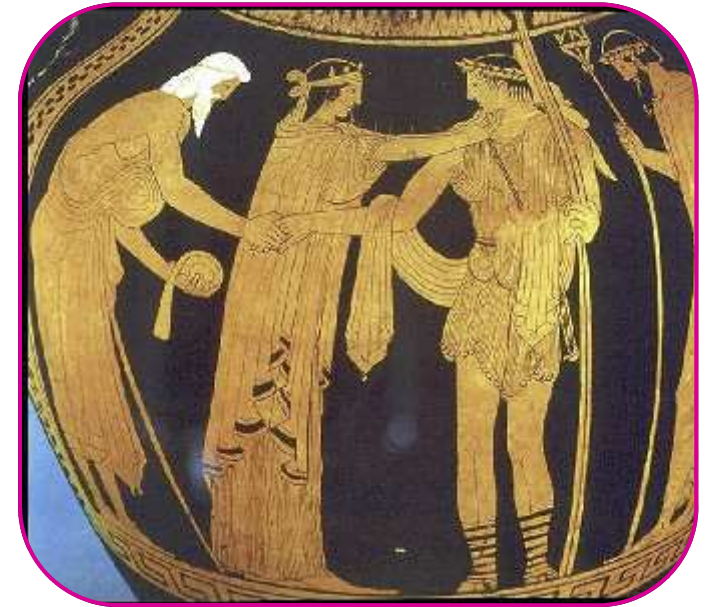
Thésée rencontrant Egée