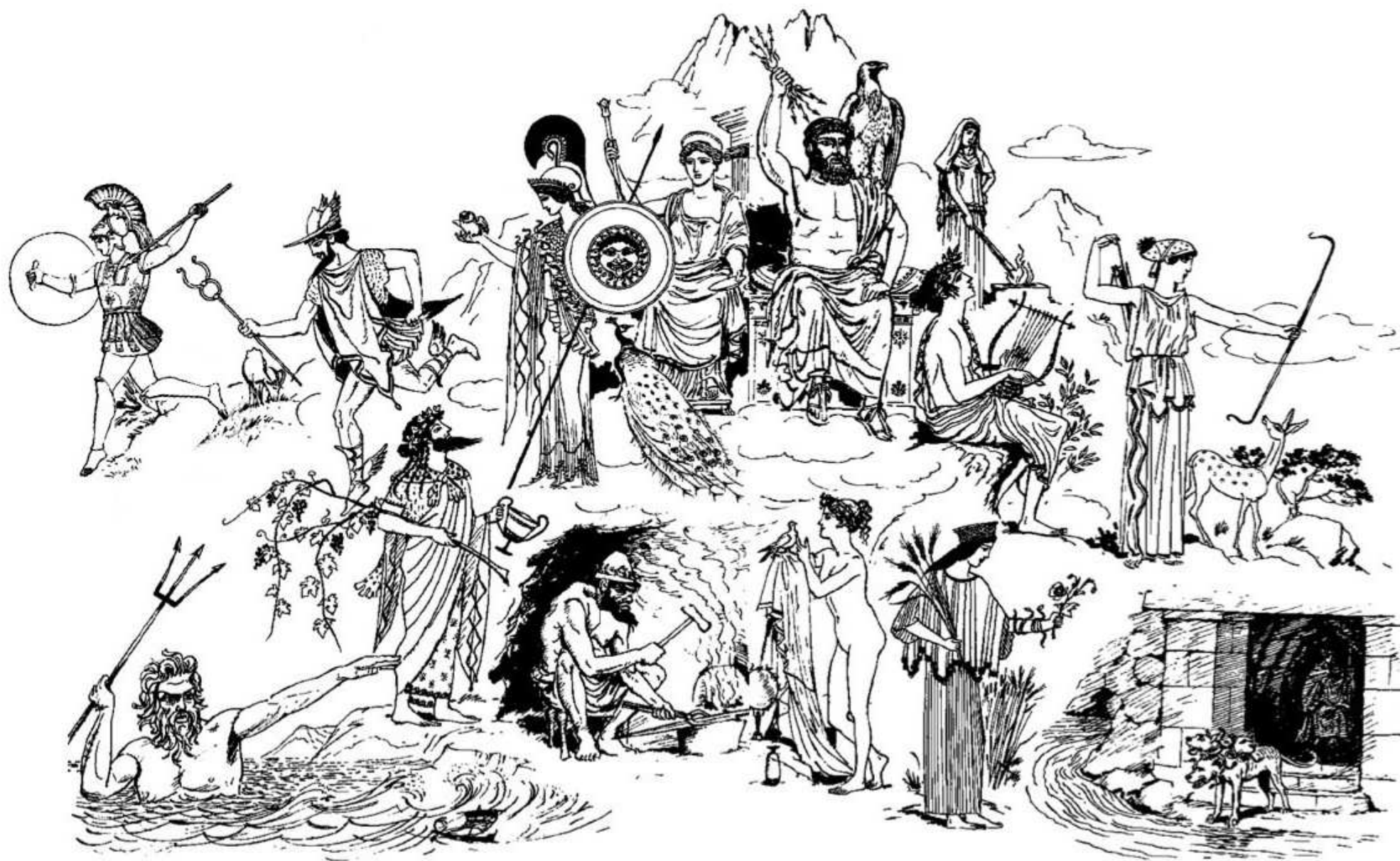
Dieux de l'Olympe