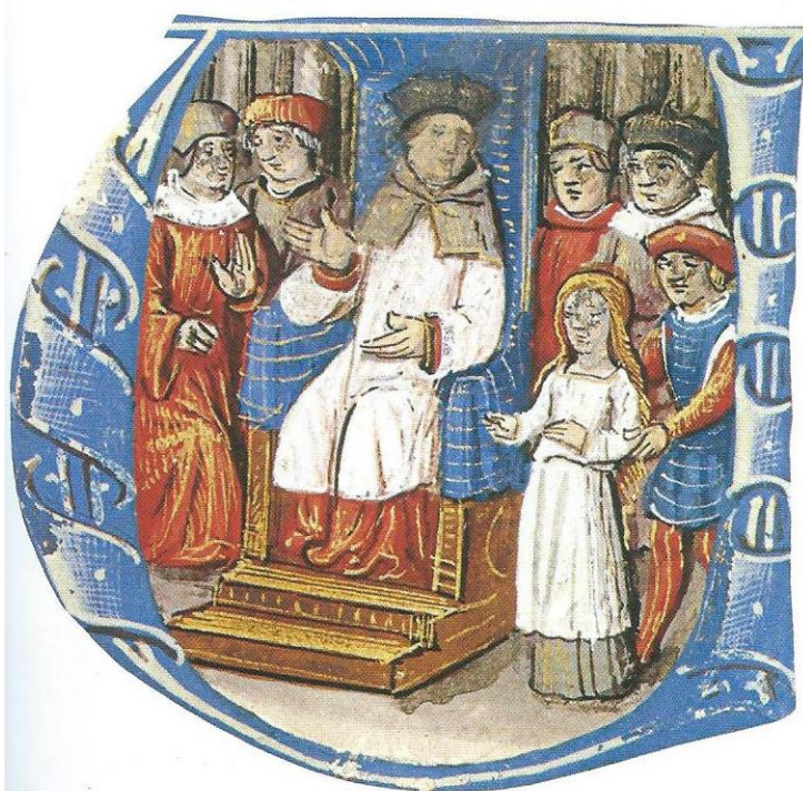
Doc. 5 Le procès de Jeanne d'Arc, janvier-mai 1431 (manuscrit du xv e siècle).

8. Décrivez Jeanne d'Arc et son attitude.