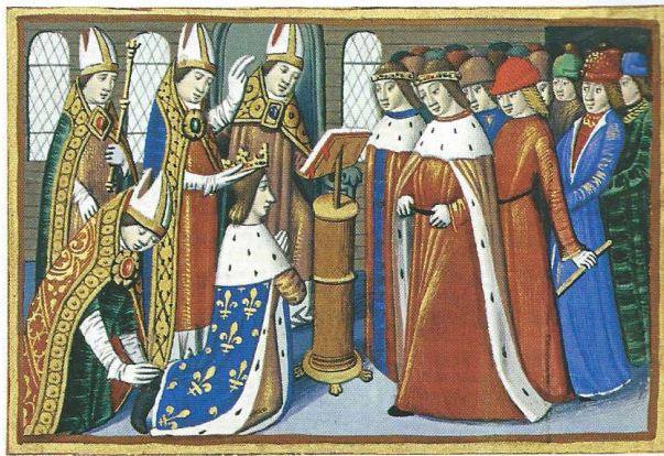
Doc. 4 Le sacre du roi Charles VII, 17 juillet 1429 (miniature du xv e siècle).

6. Pourquoi Jeanne d'Arc dit-elle à Charles VII « vous êtes le vrai roi » (Doc. 3) ?