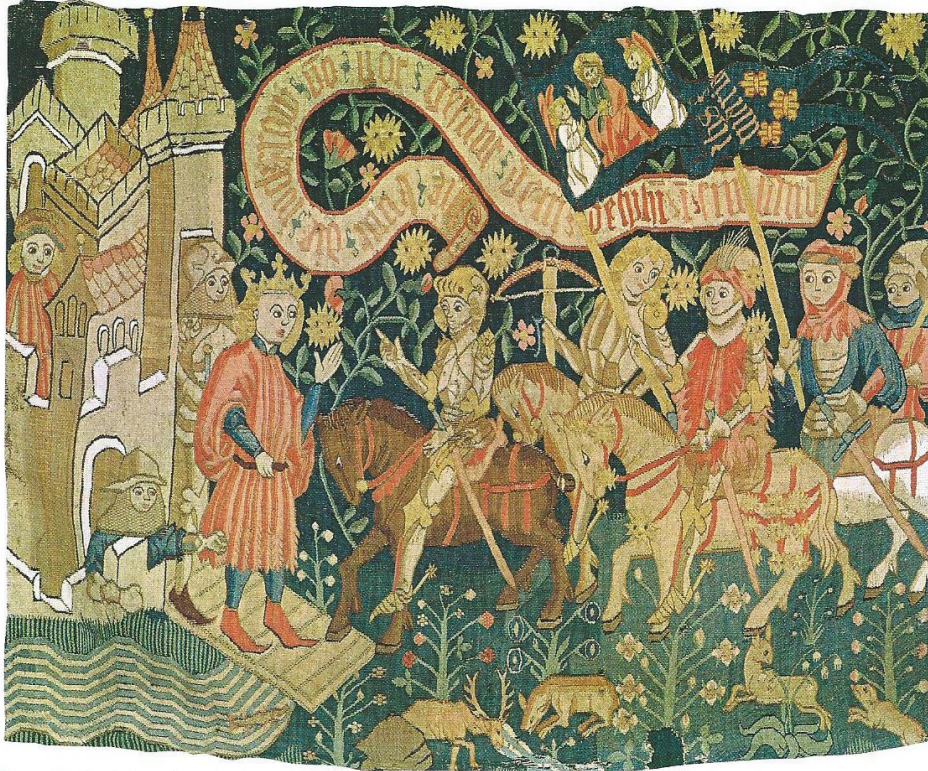
Doc. 1 Arrivée de Jeanne d'Arc à Chinon (tapisserie de Nuremberg, fin du xv e siècle). Jeanne rencontre le roi Charles VII le 25 février 1429. Elle réussit à le convaincre de se faire sacrer à Reims.