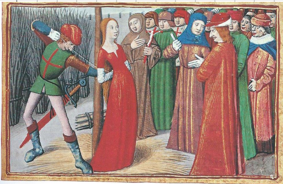
Doc. 5 Jeanne d'Arc au bûcher (miniature de 1484).

8. Que propose-t-elle au duc de Bourgogne ?