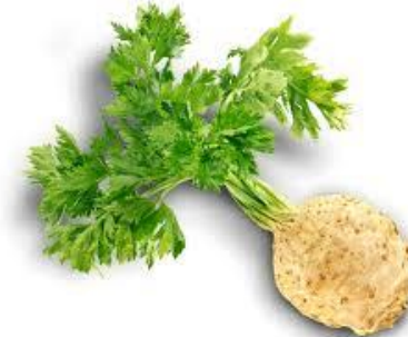
LE CÉLERI le céleri le céleri