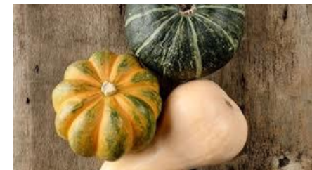
LES COURGES les courges les courges