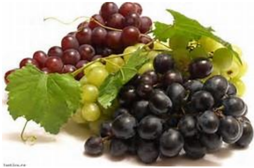
LE RAISIN le raisin le raisin