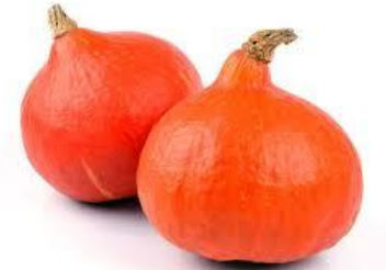
LE POTIMARRON le potimarron le potimarron