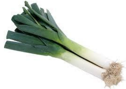
LE POIREAU le poireau le poireau