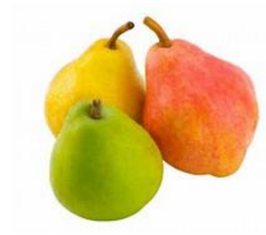
LA POIRE la poire la poire