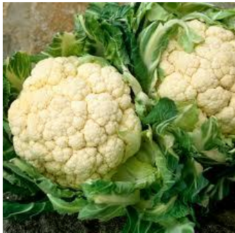
LE CHOU-FLEUR le chou-fleur le chou-fleur