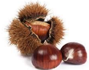
LA CHÂTAIGNE la châtaigne la châtaigne