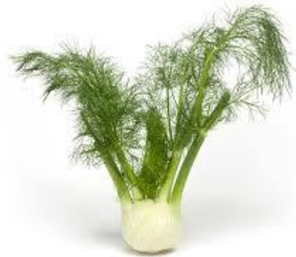
LE FENOUIL le fenouil le fenouil