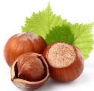
LA NOISETTE la noisette la noisette