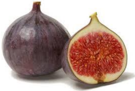
LA FIGUE la figue la figue