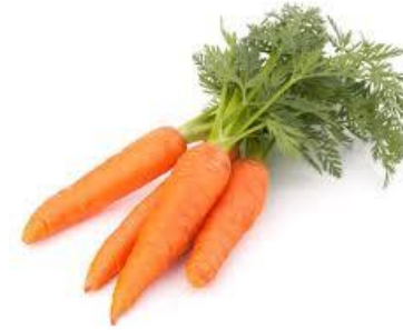
LA CAROTTE la carotte la carotte