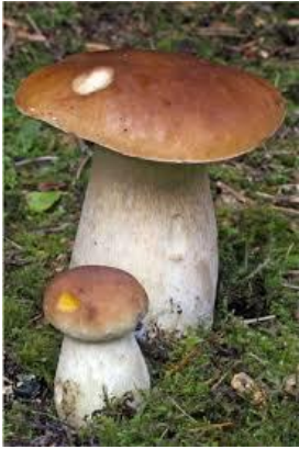
LE CHAMPIGNON le champignon le champignon