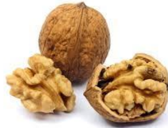
LA NOIX la noix la noix