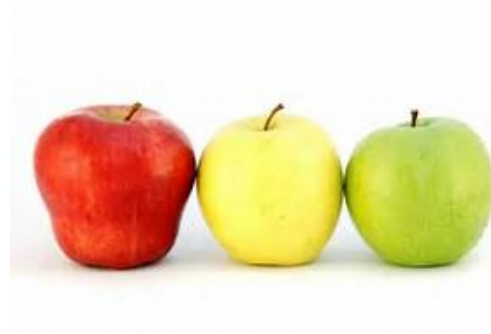
LA POMME la pomme la pomme