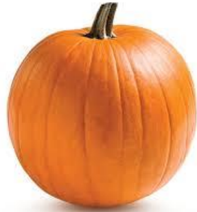
LA CITROUILLE la citrouille la citrouille