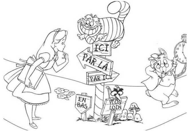
Alice cherche le chemin.