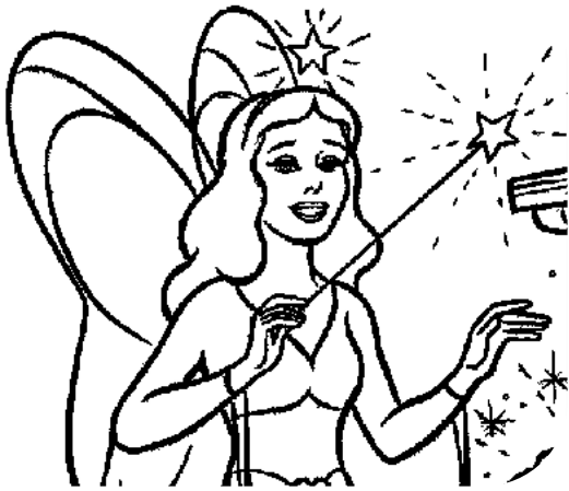
une fée - une fée