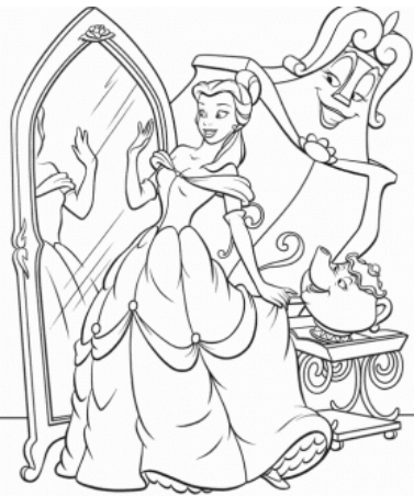
se regarder dans le miroir