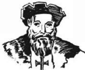
le tour de l'Afrique et des Indes