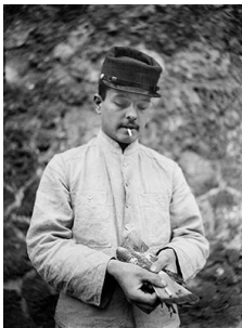
1840 Pigeon Voyageur