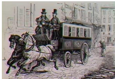
1840 Malle Poste