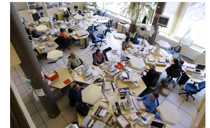
1993 AFP entièrement numérisée