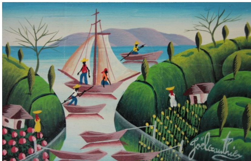
Tableau présenté au cours d'une exposition à Louhans en automne 2022

Dans ces conditions, le pouvoir s'est enfin décidé à demander à l'étranger un support militaire pour éradiquer les gangs devenus maîtres de Port au Prince, la capitale. Le Coregroup (rassemblant les Etats-Unis, le Canada, la France et le Mexique) ne répond pas et fait preuve d'une hypocrisie sans pareille, une véritable "non-assistance à Peuple en danger de mort".