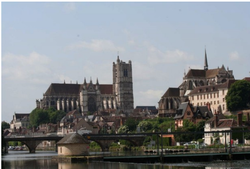
Auxerre : la cathédrale et l'abbaye saint Germain

Citation : Auxerre et Marie-Noël, Collection des Points Cardinaux, Zodiaque 1992, Page 14