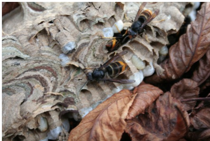
Le nid de Frelon est tomb  au sol au cours d'une temp te : le photographe a pu s'approcher, sans que les insectes manifestent d'agressivit 

Le Frelon asiatique ( Vespa velutina ) est originaire de Chine et a  t  introduit en Europe en 2004, lors de la fameuse vague d'importation de bonsa s et commet aujourd'hui de grands d g ts sur les colonies d'abeilles mellif res. Le Frelon asiatique nourrit ses larves avec les abeilles qu'il capture devant l'entr e des ruches, la grande quantit  de proies faciles pouvant expliquer cette sp cialisation du pr dateur. Mais l'adulte du Frelon asiatique est strictement v g tarien et consomme pollen, nectar et fruits. Il construit au minimum deux nids successifs, en forme de ballons ovales, souvent   grande hauteur dans un arbre, en fabriquant une p te   papier m lant du bois et de la salive. mais il peut aussi construire son nid   proximit  des habitations (balcons, dessous de fen tres...).