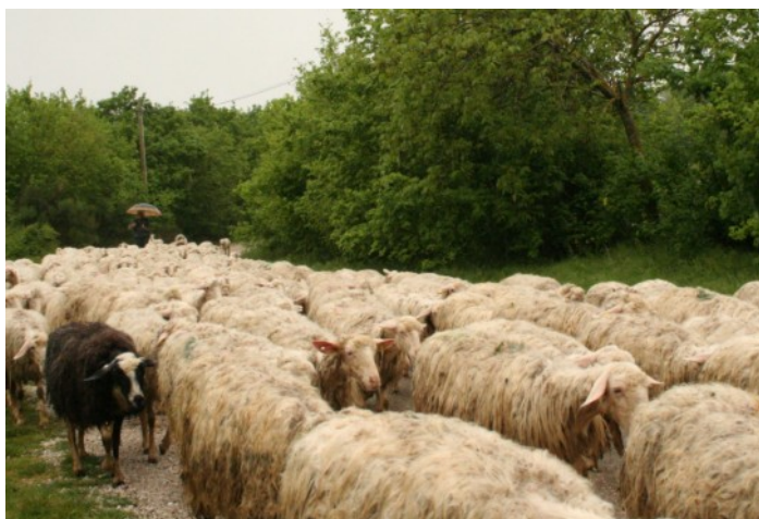
L'intendant prend soin des créatures qui lui sont confiées

Noël 1223 à Greccio. En organisant cette crèche, François d'Assise est-il en attente d'une démonstration de puissance ? Certainement pas. Il n'a qu'un désir : contempler le Mystère dans toute sa profondeur, c'est-à-dire l'Humilité qui nous rapproche des plus humbles. François contemple le Fils de Dieu se laissant déposer dans les bras de l'humanité. La nativité nous montre combien toute la volonté de Dieu est de se manifester comme un Humble devant nous.