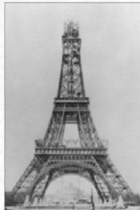
6 décembre 1888