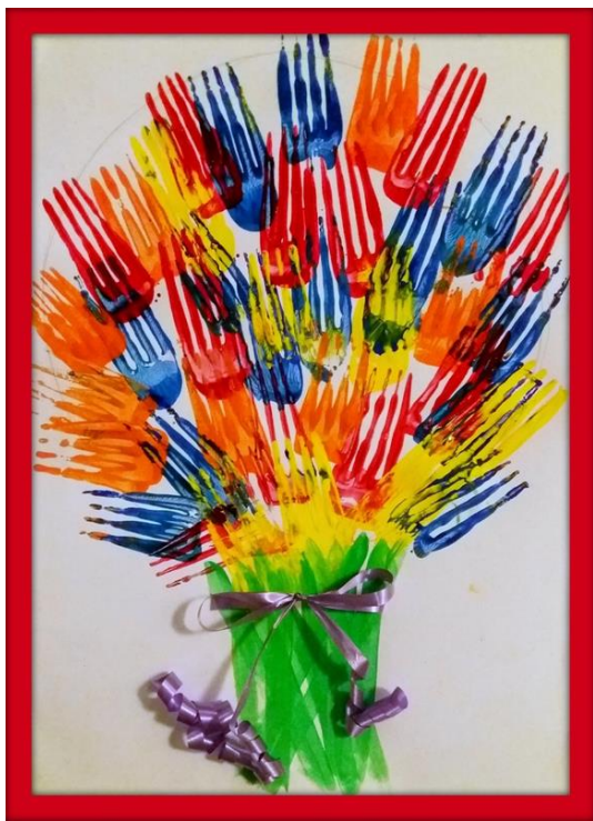
Avec des fourchettes à la peinture