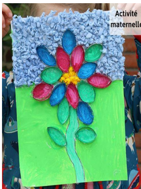
Avec un rouleau de papier toilette découpé