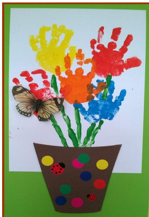
Avec tes empreintes de mains à la peinture