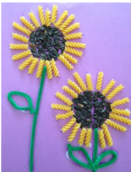
En collant des pâtes, du riz, des graines