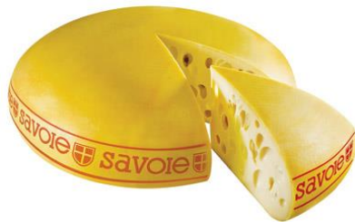
Emmental de Savoie