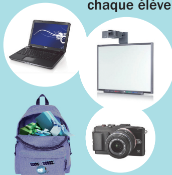
Tableau Blanc Interactif, ordinateurs, cadeaux pour chaque élève...

Téléchargez le guide du concours et inscrivez vite votre classe sur www.kit-pedagogique.total.com