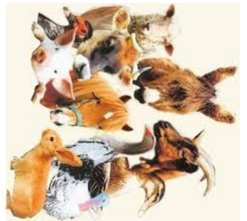
Seu letnes mîleas