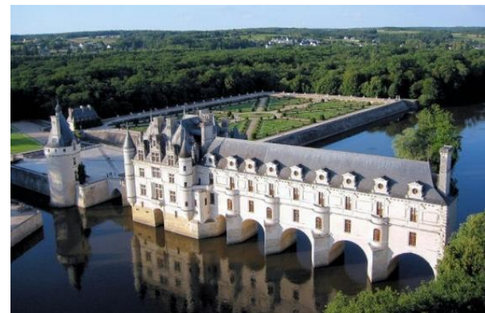
Les châteaux de la Loire

Paysages : les plaines de la Beauce, les vignobles de la Loire, le fleuve Loire